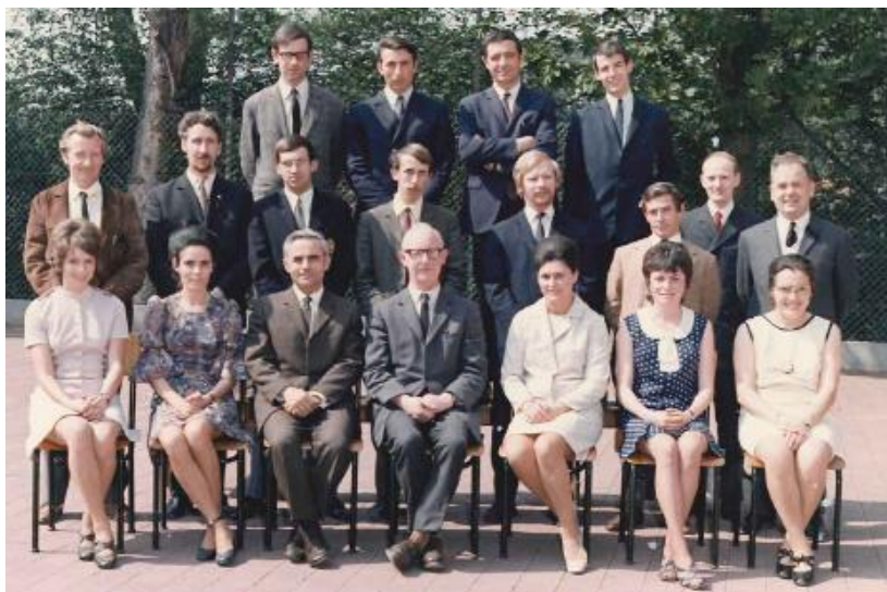
1971 Bandoede (1. o jaar van de samenve- ging 16. Hemelvaart en S. Jozef.)