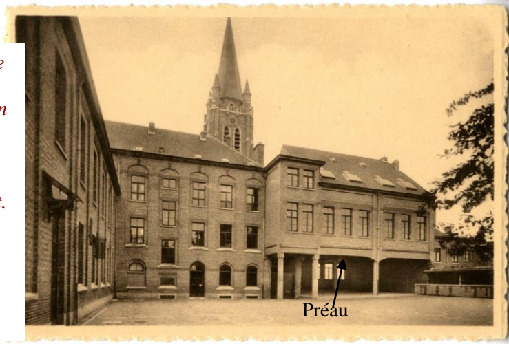
Foto van 1966 van de toenmalige « préau » die veranderd werd in turnzaal. Aan de rechterkant tegen de muur waren er ook toiletten aangebracht.